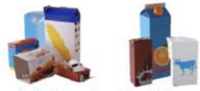
Toutes les cartonnets et briques alimentaires