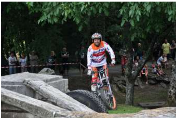
Démonstration à l'occasion de la Fête du Village.

Association « Montaud Trial Sport 38 » MTS38