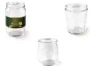
Tous les pots et bocaux en verres