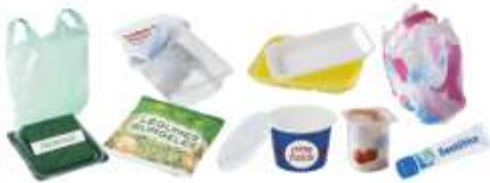
Tous les pots, barquettes, sacs et films en plastique