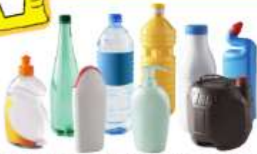
Tous les flacons et bouteilles en plastique