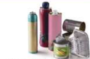
Tous les emballages métalliques