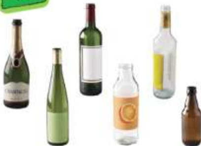
Toutes les bouteilles en verres