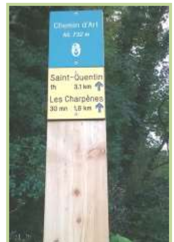
Signalétique du Chemin d'Art

Ce qui nous amène à envisager de développer ce concept en organisant sur le Printemps/Été 2017 une visite guidée. Nous vous tiendrons informés de cela au long de l'année 2017.