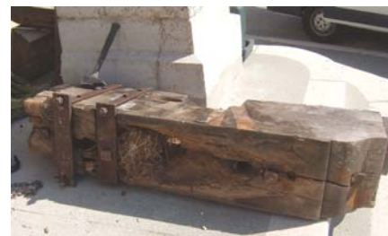
Le joug, soutenant la grosse cloche, en mauvais état, était habité par les oiseaux

Afin de sécuriser le clocher de l'église, des travaux de « projection » seront réalisés à l'intérieur de celui-ci, avec la pose d'un échafaudage. Pour cela, il a été nécessaire de déposer les deux cloches. Ce travail a été réalisé par la société Paccard. Pour information, la plus petite cloche, en bronze, pèse environ 100 kg. Alors que la plus grosse, en acier, d'un diamètre de 1,30 m, pèse plus d'une tonne.