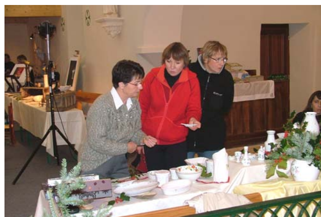
Marché de Noël 2009