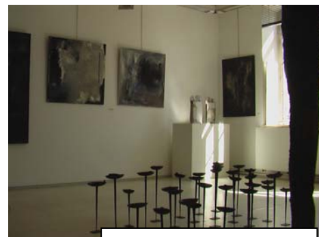
Villard de Lans

La maxime de 2010: ALLER AU BOUT DE SES ENVIES !!