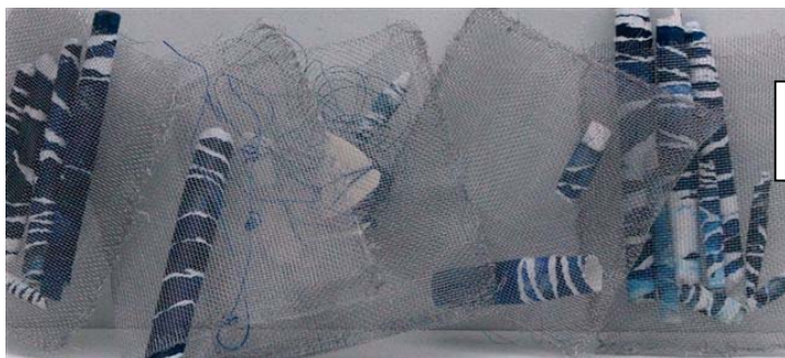
Travail de B. Long à BERLIN