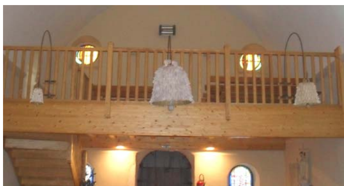
Journées du patrimoine