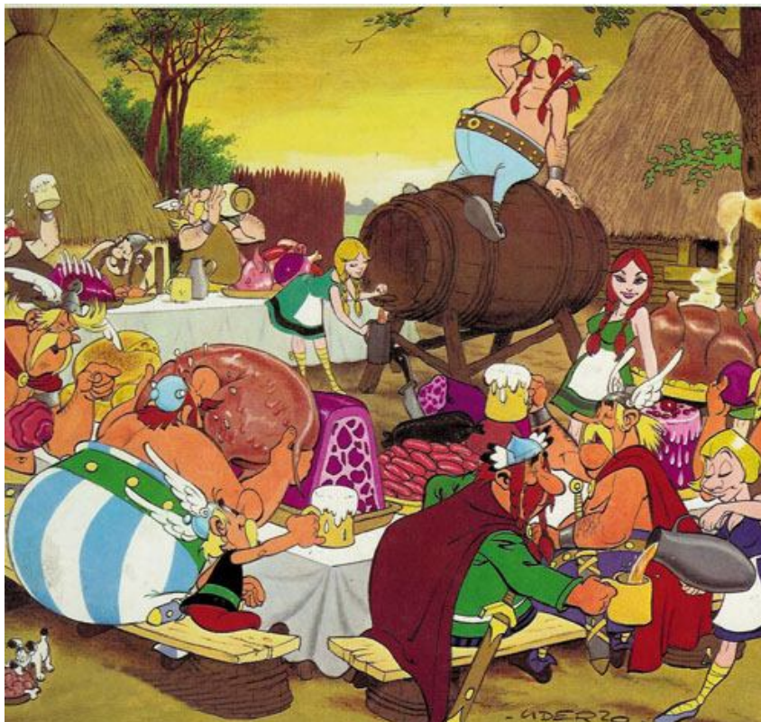
Repas de la fête du Village !

Signé : Un nouvel habitant qui remercie les Montaudines et Montaudins de les avoir accueillis dans leur tribu.